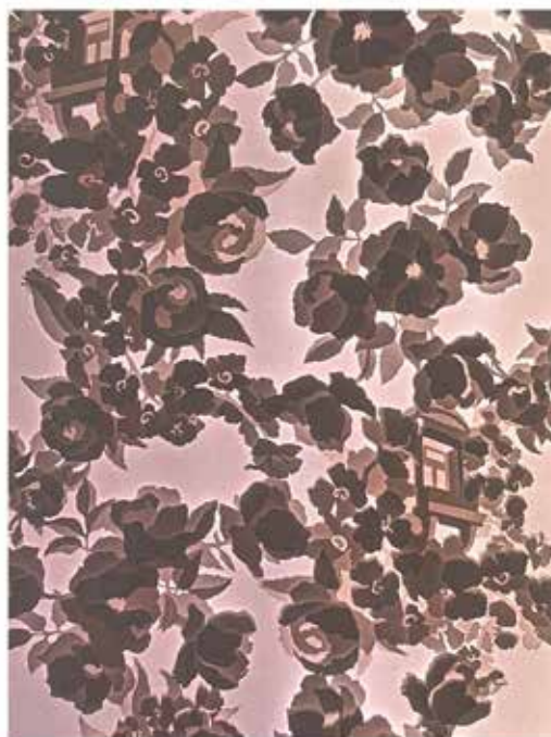
'If plants could speak VI Acid free paper, glue, LED light 154 x 78 x 14 cm