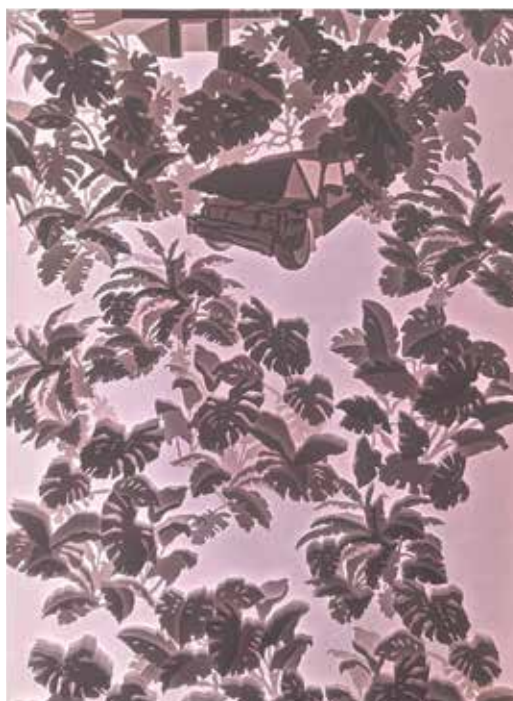
'If plants could speak VIII Acid free paper, glue, LED light 154 x 78 x 14 cm