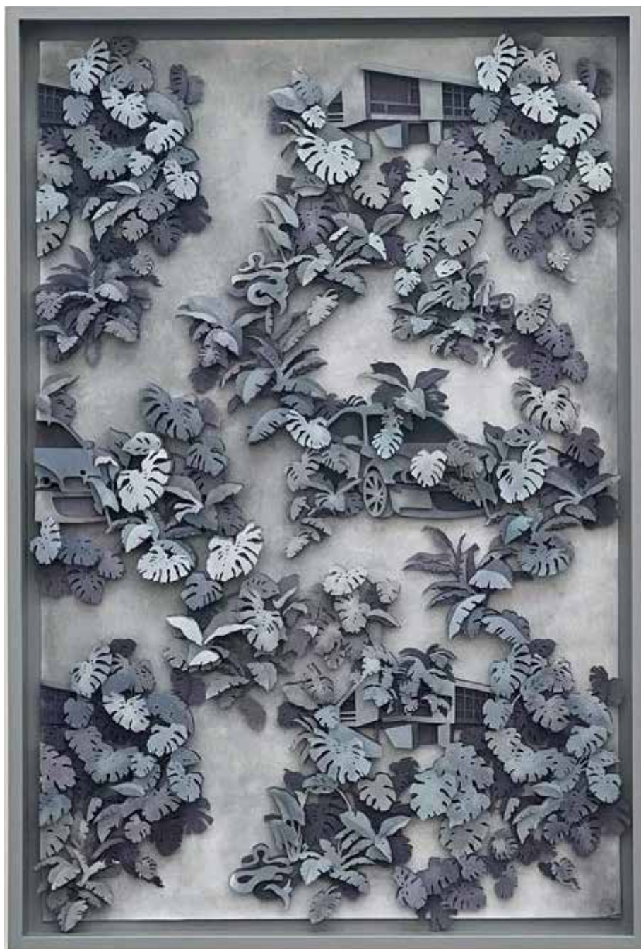
STINNE BO 'If plants could speak I' 2023 158 x 106 x 9 cm