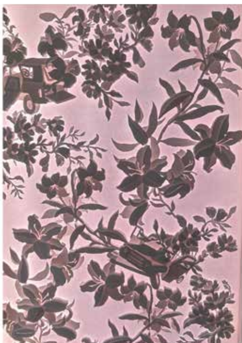
'If plants could speak VII Acid free paper, glue, LED light 154 x 78 x 14 cm