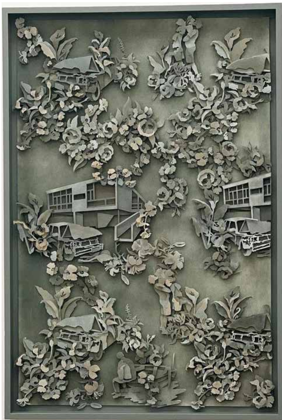
STINNE BO 'If plants could speak III' 2023 158 x 106 x 9 cm