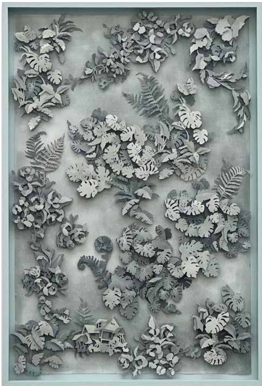
STINNE BO 'If plants could speak IV' 2023 158 x 106 x 9 cm